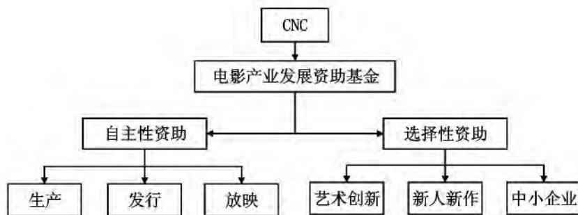
图2 法国电影产业资助类型与范围

1994年起,CNC完善了产业资助体系,逐步形成自主性资助和选择性资助两种形式。自主性资助来源于影视作品在影院、电视台等媒介播放所产生的纳入资助基金账户的税款,CNC根据特定条件分配和返还给生产、发行和放映三个环节的参与者,其用途严格限定在电影产业内的持续生产和经营。选择性资助政府每年通过国家电影中心下属的8个委员会从大量本国故事长片、外语片、合拍片、短片等候选剧本中挑选优秀剧本,给予创作补助,在筹拍过程中再给予相当于影片预算5%至6%的资金补助,以实现鼓励艺术创新,扶持新人新作,保护中小型制作公司的目的。此外选择性资助还承担了公益性宣传、教育、培训等职能。